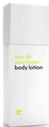
BODY LOTION Bodylotion