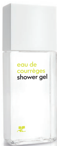
SHOWER GEL Duschgel