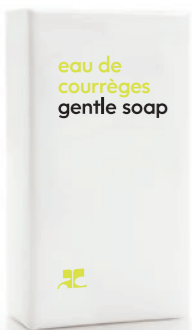
SOAP Seife 1.41 oz / 40 g