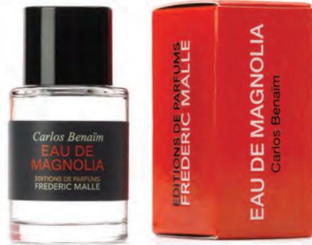
EAU DE MAGNOLIA EAU DE TOILETTE 7 ml - 0.24 FL.OZ