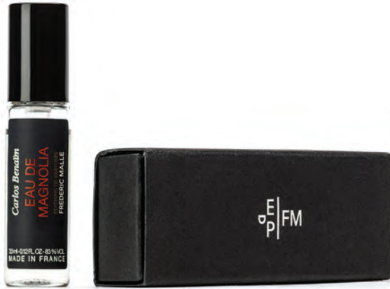
EAU DE MAGNOLIA EAU DE TOILETTE 3.5 ml - 0.12 FL.OZ

To extend the experience / Pour prolonger l'expérience