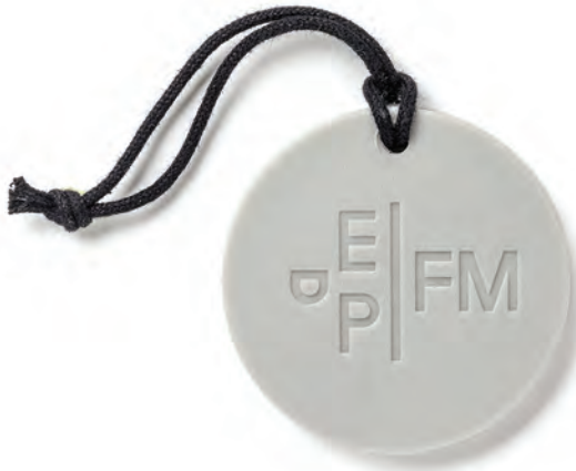
EAU DE MAGNOLIA RUBBER INCENSE MEDALLION