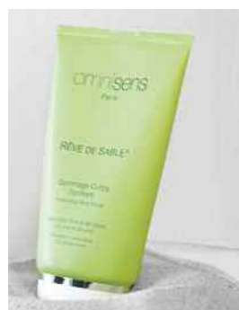
RÊVE DE SABLE® 150 mL - 5.17 Fl.Oz. Invigorating Body Scrub Gommage Corps Tonifiant