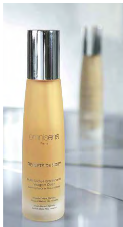
REFLETS DE SOIE® 100 mL - 3.3 Fl.Oz. Soothing Dry Oil for Face and Body Huile Sèche Réconfortante Visage et Corps