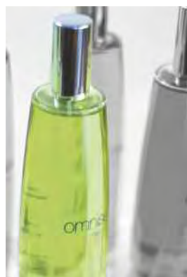
PARFUM D'INTÉRIEUR 100 mL - 3.3 Fl.Oz. Home Fragrance Spray with Essential Oils Brumisateurs aux Huiles Essentielles