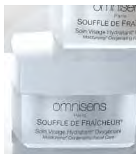
SOUFFLE DE FRAÎCHEUR® 50 mL - 1.7 Fl.Oz. Moisturizing Oxygenating Facial Care Soins Visage Hydratant Oxygénant